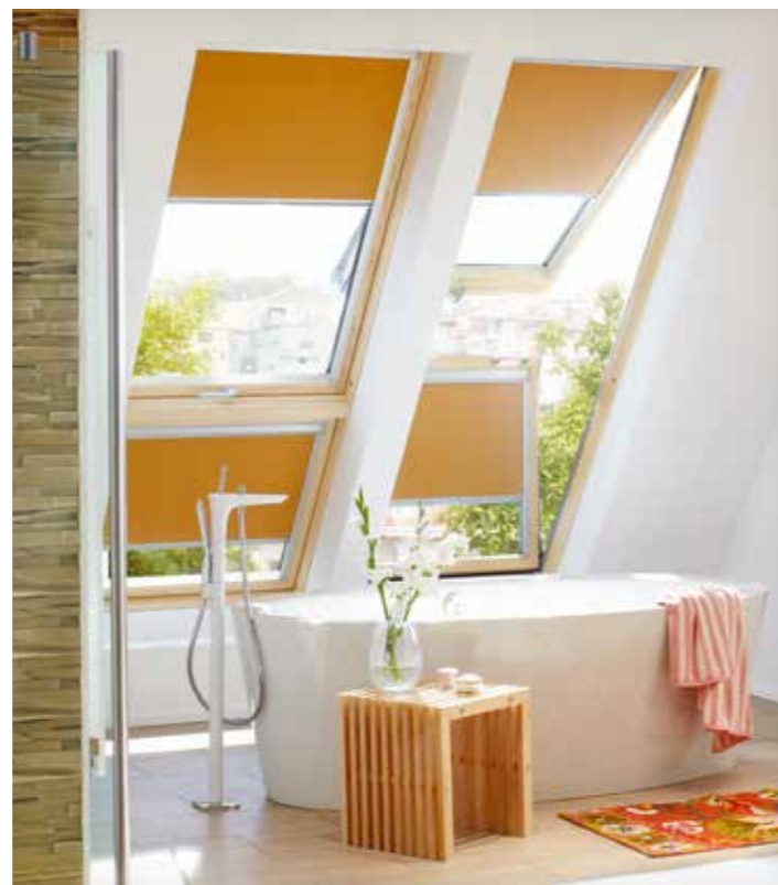
Maßgeschneiderte Rollos in verschiedenen Ausführungen bieten optimalen Schutz vor Überhitzung und passen sich dezent an jede Raumsituation an.