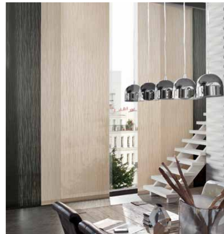
Als schmückende Accessoires und um den Behang beim Verschieben zu stabilisieren, können edle Applikationen, Abschlussprofile und Bediengriffe aus Holz oder Metall befestigt werden.