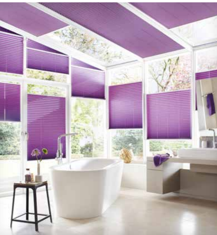
Nicht nur Dekoration sondern auch Hitze- und Kälteschutz. Wabenplissees von erfal wirken isolierend durch einen speziellen Gewebeaufbau mit Thermobeschichtung.

Flächenvorhänge sind wie geschaffen für große Fensterfronten und Glasflächen in modernen Wohnräumen und Büros. Als großflächige Sichtregulierung und durch flexible Verschiebbarkeit der Stoffbahnen lassen sich Flächenvorhänge auch als Raumteiler einsetzen.