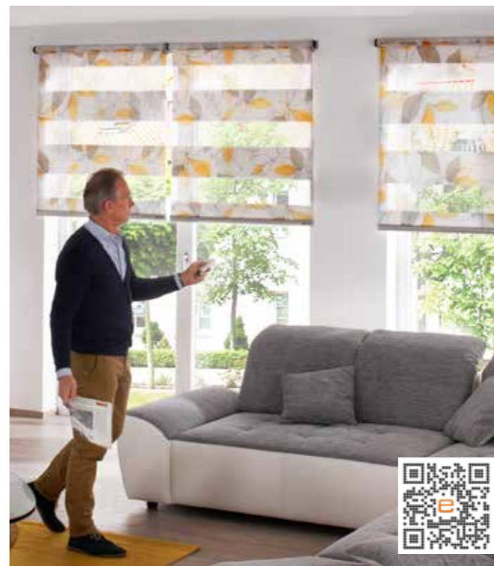
Mit nur einem Tastendruck auf der Fernbedienung können Sie bei elektrischen Doppelrollos gleichzeitig Höhe und Durchsicht ganz nach Ihren Wünschen einstellen.